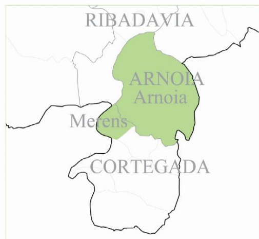
Área Protegida de la IGP “Pemento da Arnoia”